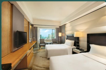
成都皇冠假日酒店 或同級 ★★★★★