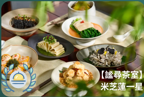
【謔尋茶室】 米芝蓮一星