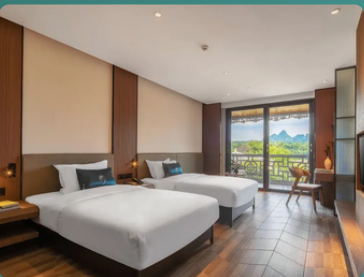
陽朔漓岸璞閑酒店 或同級 ★★★★★