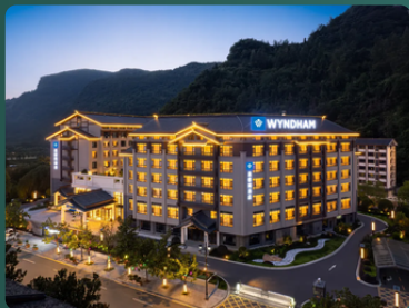
張家界瑞景縵山溫德姆 或同級 ★★★★★