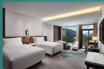
九寨天堂酒店 或同級 ★★★★★